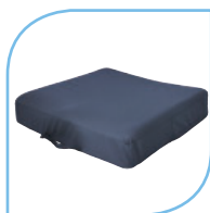
Coussin Visco-élastique Classe II