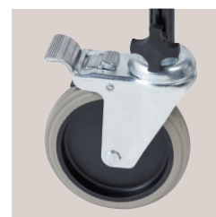
2 roues avec freins