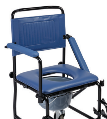
Accoudoirs et repose-pieds amovibles