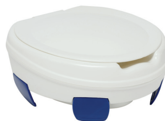
Clipper® III avec couvercle